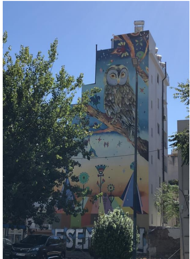
Τοιχογραφία με Κουκουβάγια, Περιοχή Κεραμικός, (φωτο: Β. Κονδύλη)