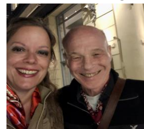
Πρόσφατη φωτο του Δρ. Τικ με την Πρόεδρο της AGC, στην Αθήνα.

Ιδέες ρέουν, με καλλιτέχνες και θεραπευτές όπως με το Επίτιμο μέλος του Διοικητικού Συμβουλίου μας Edward Tick, Ph.D. συγγραφέα πολλών βιβλίων μεταξύ των οποίων: Soul Medicine: Healing through Dream Incubation, Visions, Oracles, and Pilgrimage .