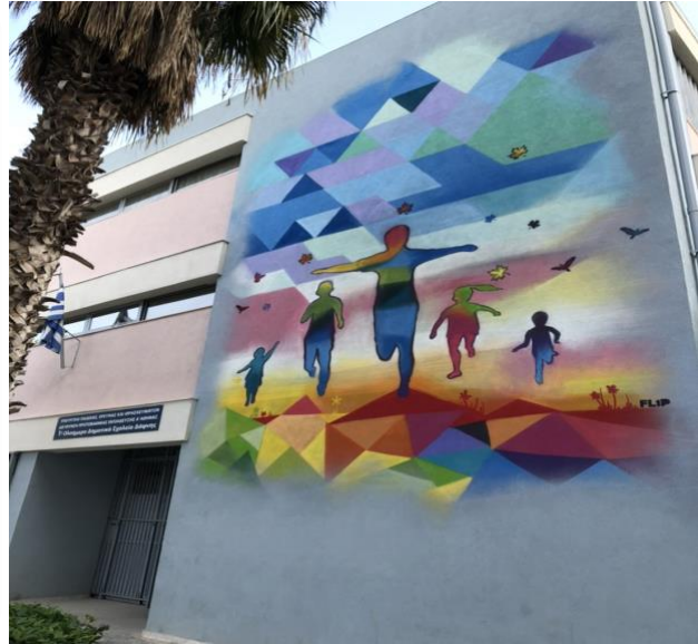
Τοιχογραφία του INO, περιοχή Μεταξουργείο (αριστερά), Τοιχογραφία του FLIP Ολοήμερο σχολείο Δάφνης (δεξιά)