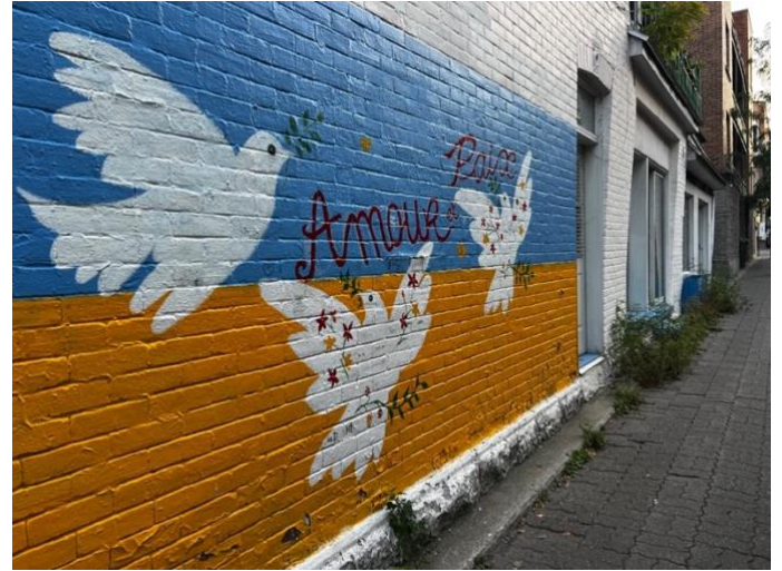
Τοιχογραφία στο Μόντρεαλ, Καναδά