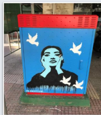
ΚΑΦΑΟ με stencil της Μαρίας Κάλλας στο Ελληνικό