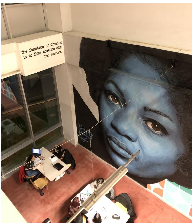
Τοιχογραφία της Toni Morrison Mural, σε χώρο φοιτητών, Πανεπιστήμιο της Σαπιέντζα, Ρώμη