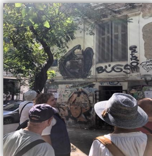
Επιμορφωτικός Περίπατος με Human Links, Κουκάκι, Αθήνα