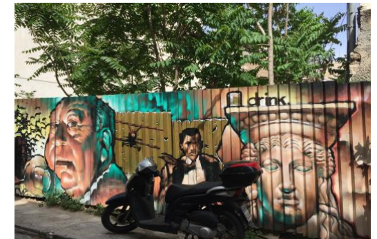
Τέχνη του δρόμου, περιοχή Ακρόπολης

Η AGC απευθύνεται σε εφήβους και νέους, σε taggers και streetartists, σε επιστήμονες και ερευνητές, σε όλα τα στρώματα των κατοίκων του κέντρου, στις τοπικές επιχειρήσεις, τους επισκέπτες του κέντρου και τους τουρίστες. Η AGC φιλοδοξεί να συνεισφέρει ενεργά στην αστική καινοτομία, να ερευνά και να καταγράφει την υλική, άυλη και υβριδική κληρονομιά του δημόσιου αστικού χώρου, να προάγει την κατανόηση σύνθετων πολιτισμικών φαινομένων στον αστικό δημόσιο χώρο, και να καλλιεργεί κοινωνικές και καλλιτεχνικές δεξιότητες σε ευρείες ομάδες, με αξιόπλοηγους την καινοτομία, τη συνέργεια, την ανοικτότητα, την ορατότητα, τον κοινωνικό και αισθητικό διάλογο, τη συμπερίληψη και τη βιωσιμότητα.