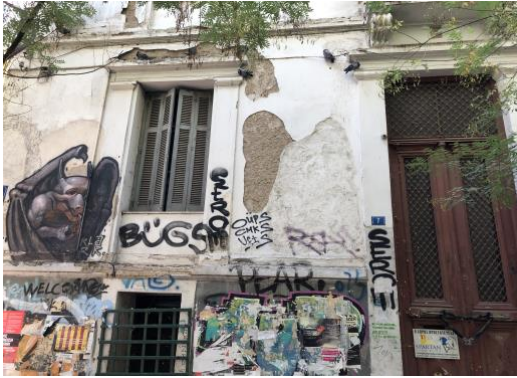
Tagging, γκράφιτι και τέχνη του δρόμου, Κουκάκι