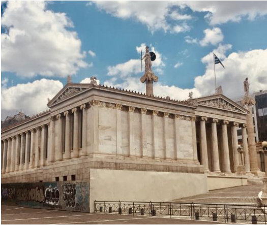
Δύο Πλευρές, Πανεπιστήμιο – Τριλογία Αθήνας